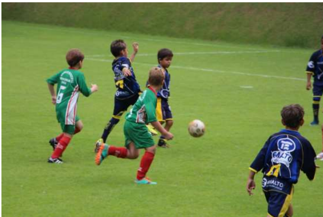
21/03/2015 – Projeto Atleta Nota 10