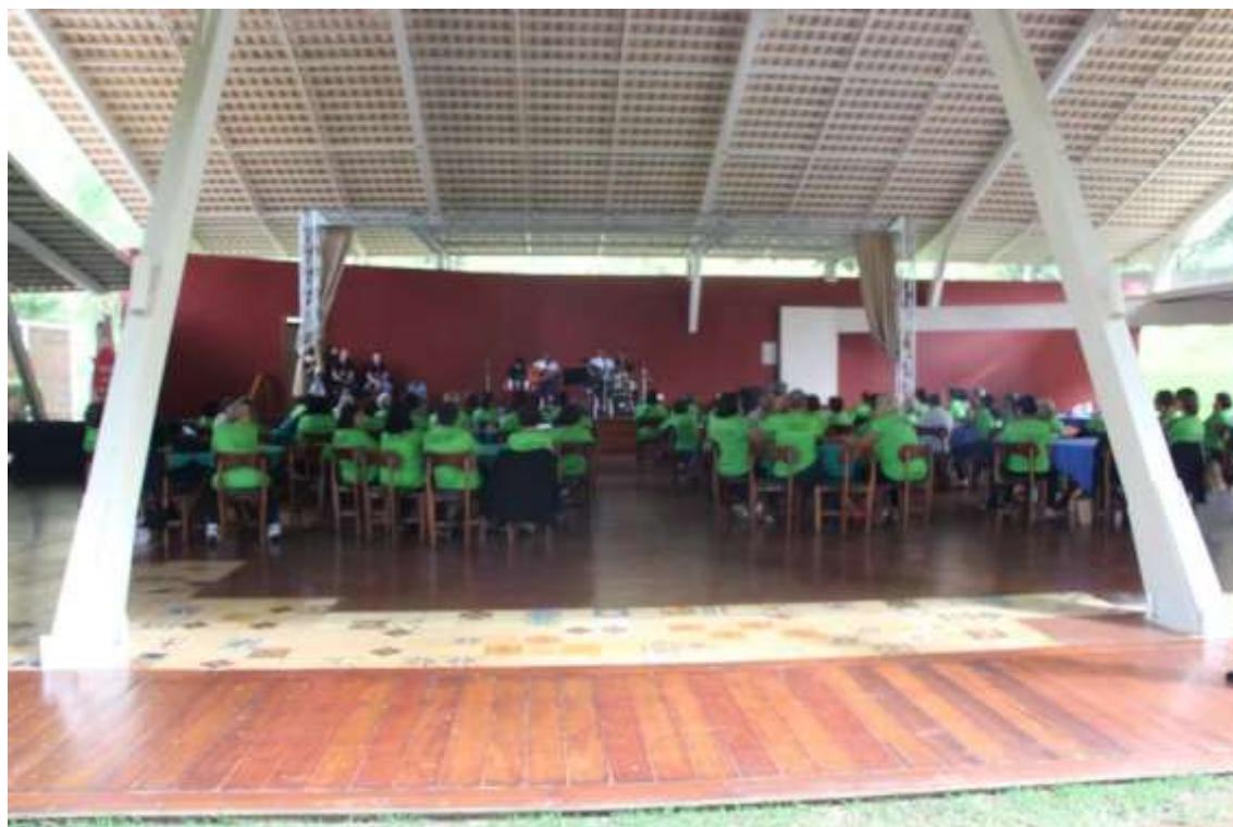
16/05/2015 – Apresentação homenagem às mães “GRUPO REVIVER”