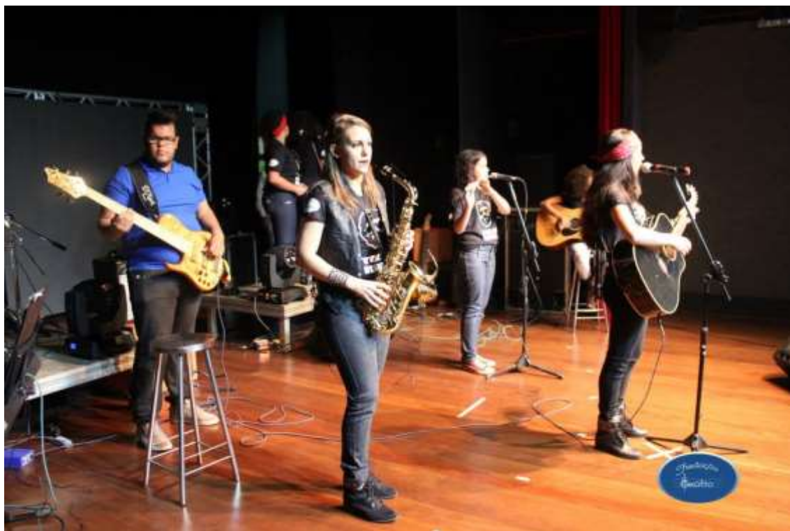
28/08/2015 – Apresentação Fundação APERAM – “TOCA RAUL”