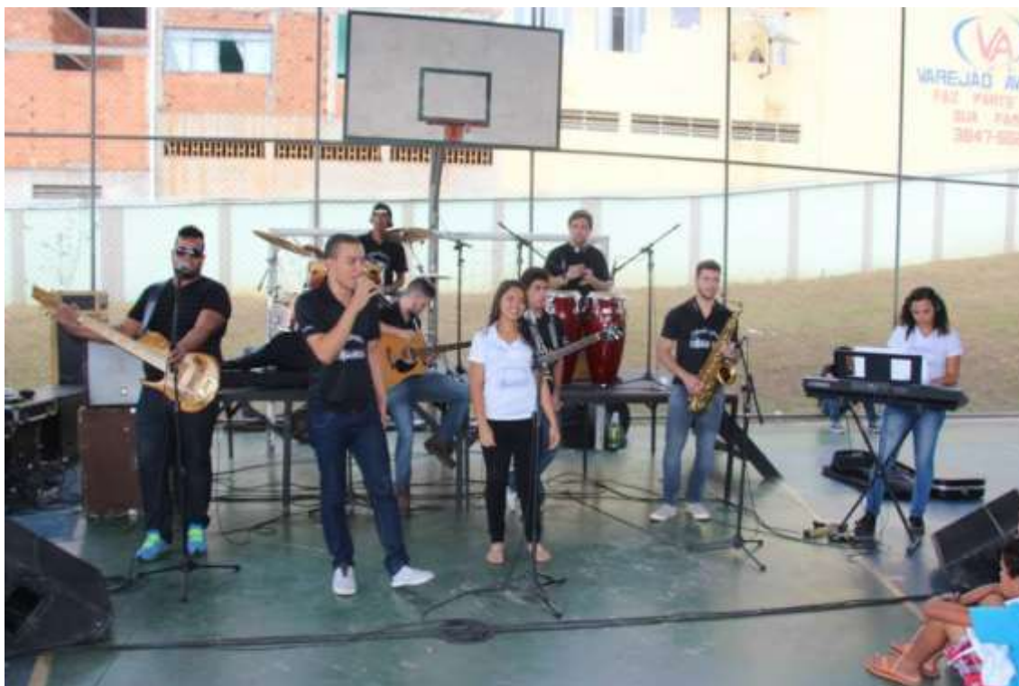
30/05/2015 – Apresentação projeto “EPREENDER SOCIAL”