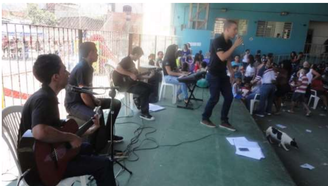
19/09/2015 – Apresentação projeto “EMPREENDEDOR SOCIAL”