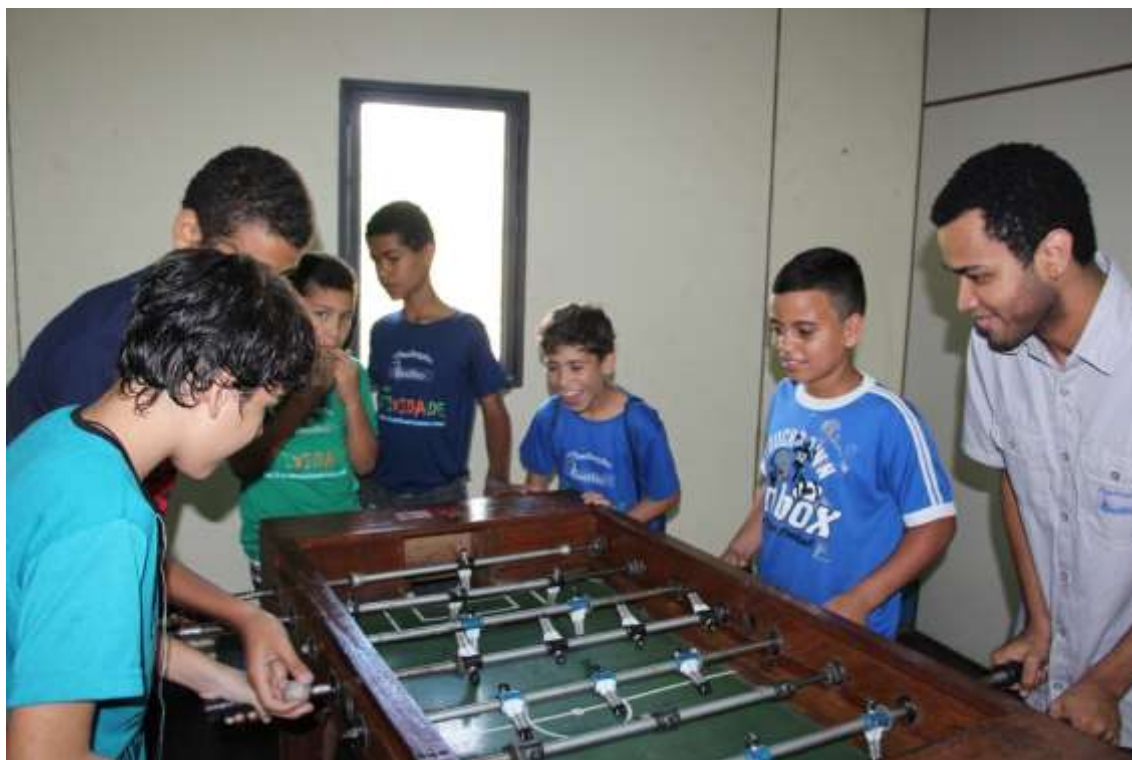
20/07 à 24/07/2015 – Semana de Férias