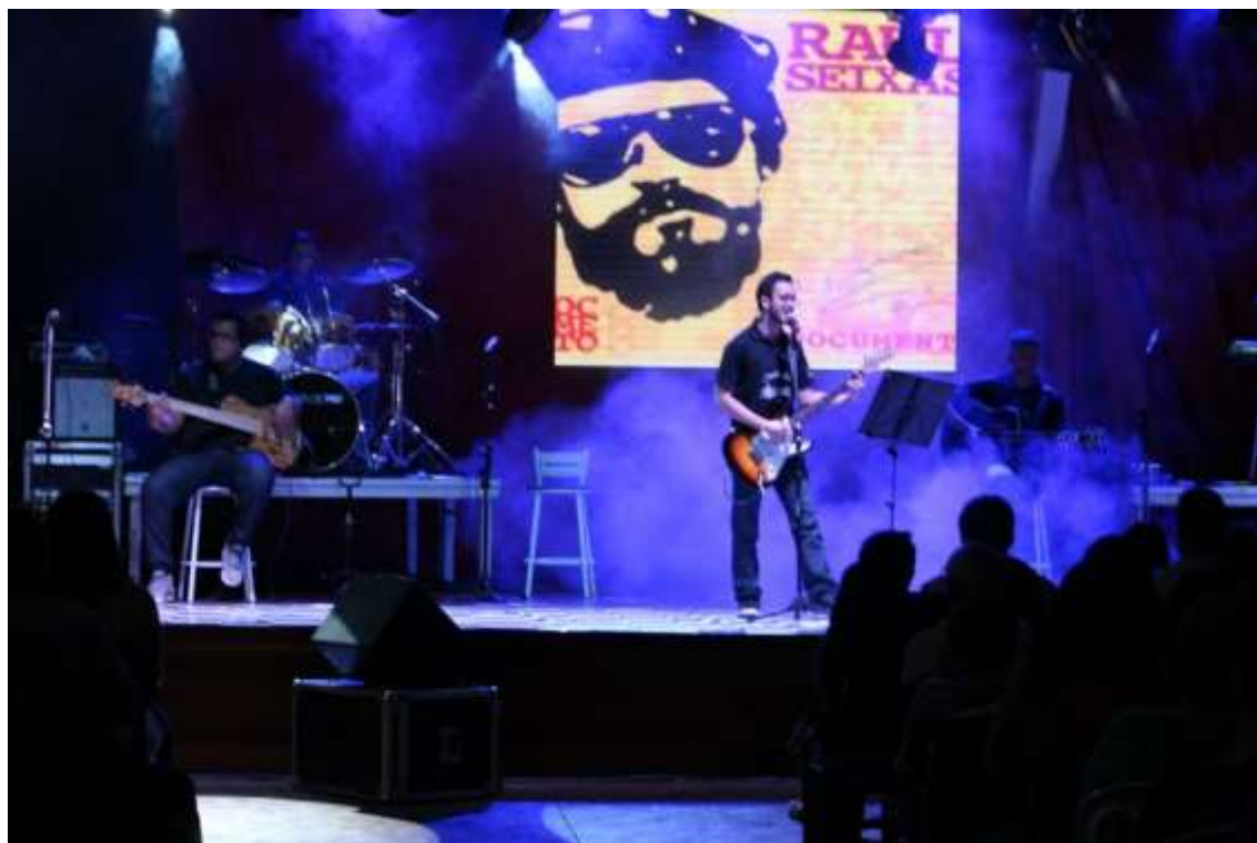
19/06/2015 – FESTIVAL LITERÁRIO