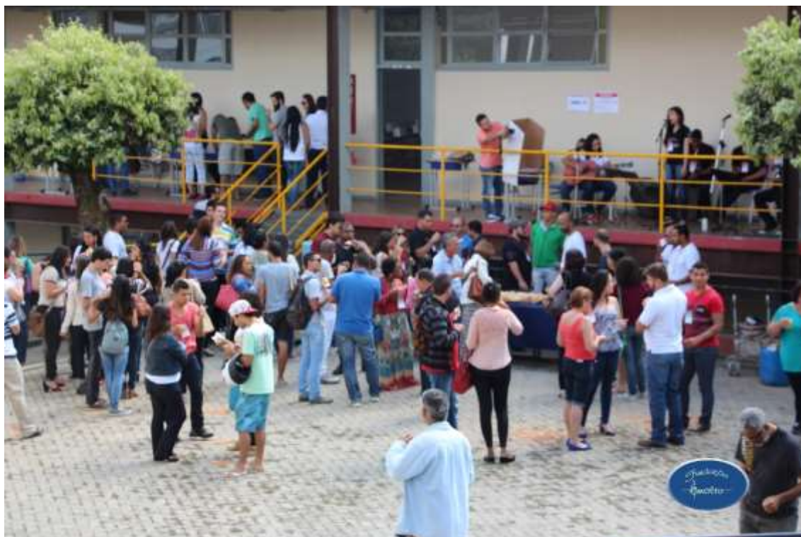
07/08/2015 – Conferência Municipal da Juventude