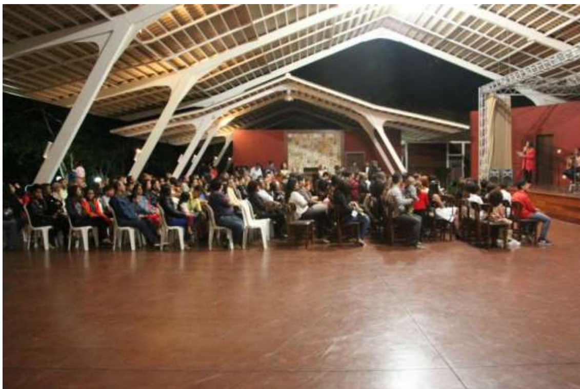
14/07/2015 – Formatura 1º Semestre