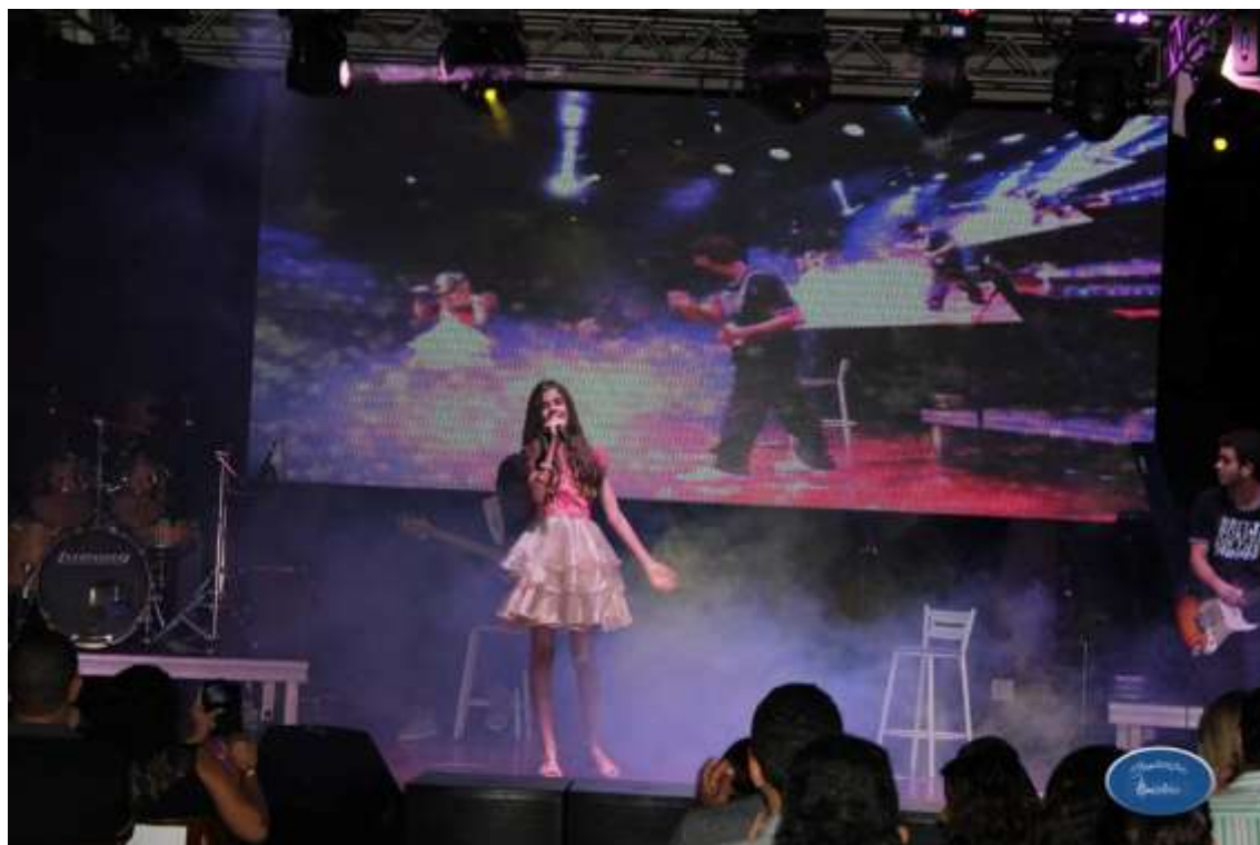
27/11/2015 – 11ª MOSTRA ARTÍSTICA