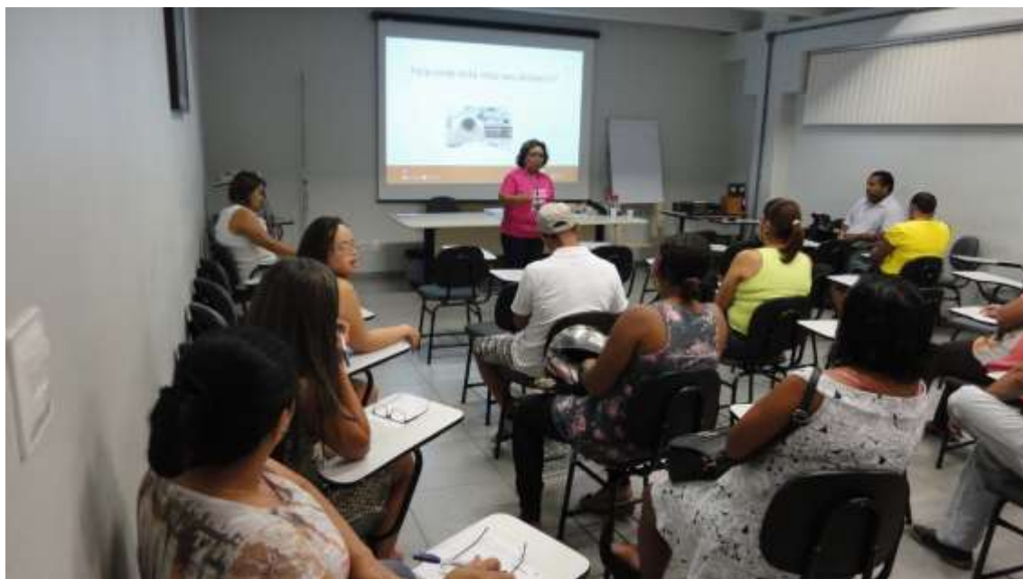
26/03 à 10/11/2015 – Escola de Pais