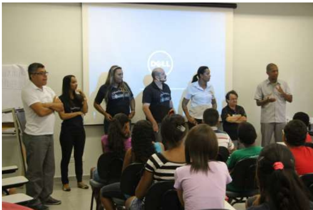
03/02/2015 – Aula inaugural