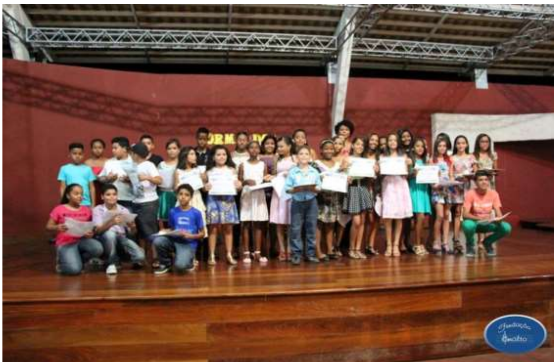
16/12/2015 – Formatura 2º Semestre