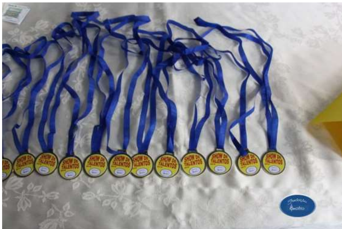
25/09/2015 – SHOW DE TALENTOS