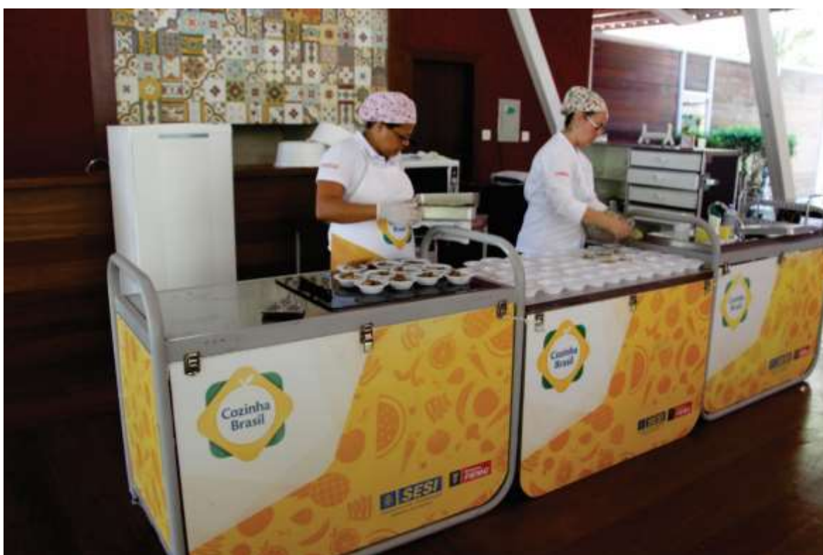
TORNEIO DE INTEGRAÇÃO – 02/04/2016