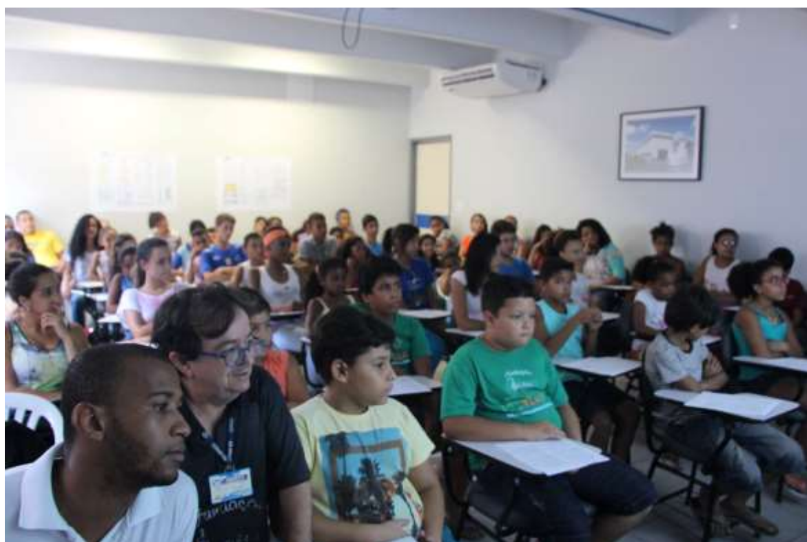
INALGURAÇÃO PROJETO "CANTANDO E ENCANTANDO" - 18/02/2017