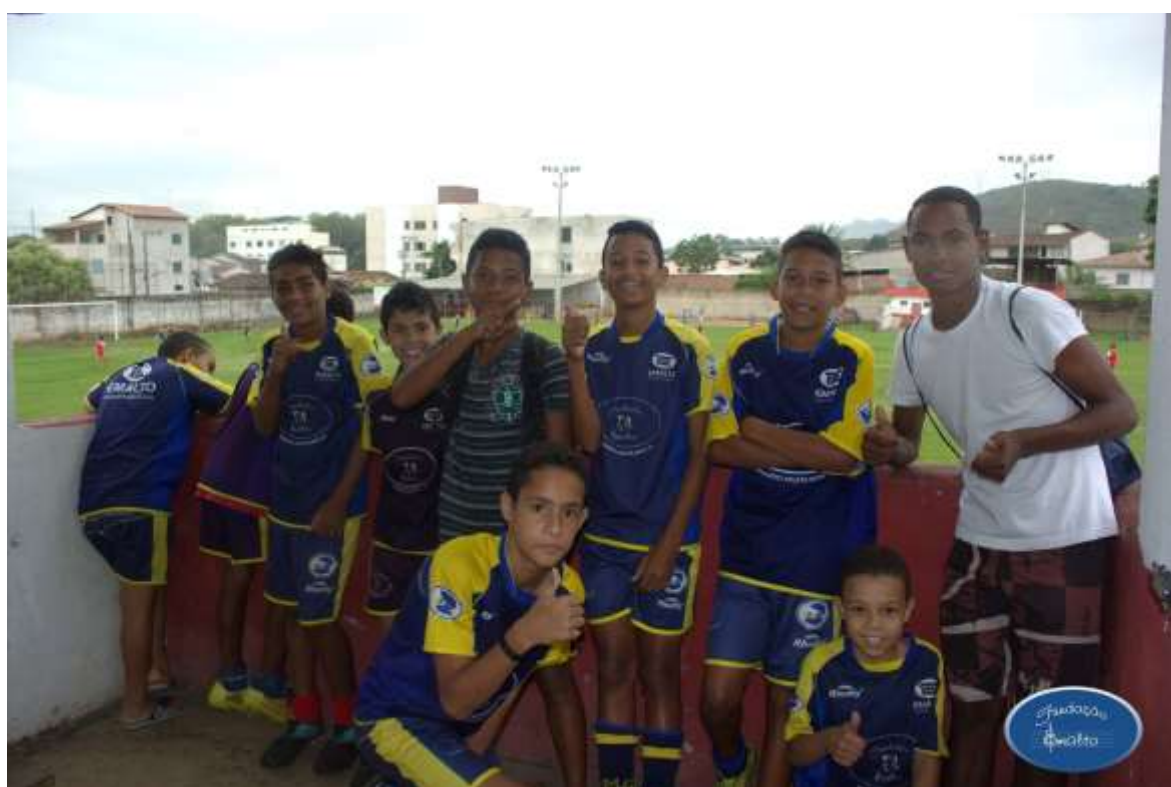
Apresentação Proerd 2016 – 29/11/2016